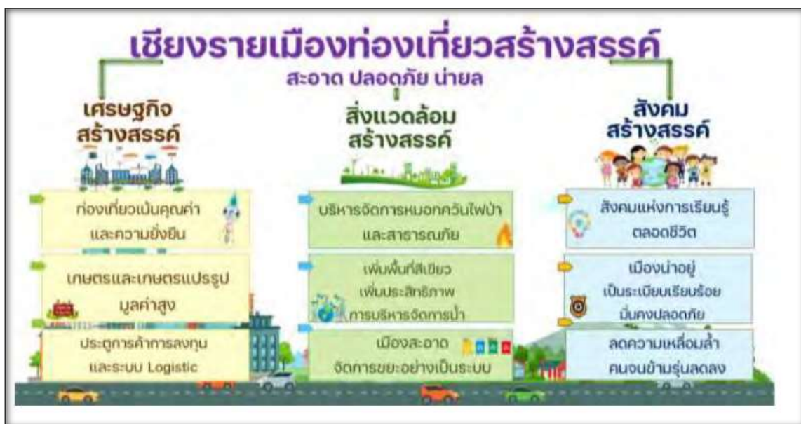
ภาพเป้าหมายการพัฒนาจังหวัดเชียงราย

เป้าหมายพัฒนาลี้ังคมสร้างสรรค์: เพื่อยกระดับคุณภาพชีวิต ลดความเหลื่อมล้ำในสังคมส่งเสริมการเรียนรู้ตลอดชีวิตสำหรับคนทุกช่วงวัย และเสริมสร้างความปลอดภัยและความมั่นคงในชีวิตทรัพย์สินของประชาชนเพื่อนำไปสู่สังคมสร้างสรรค์