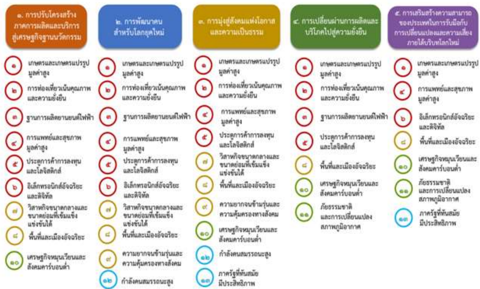
แผนภาพที่ ๓.๑ ความเชื่อมโยงระหว่างหนุดหมายการพัฒนา กับเป้าหมายหลัก