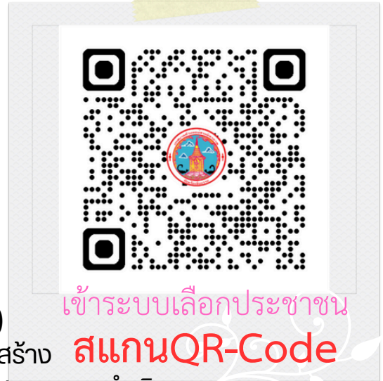
เข้าระบบเลือกประชาชน สแกนQR-Code